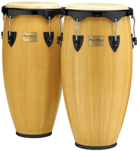
CONGAS (Conga y Quinto)