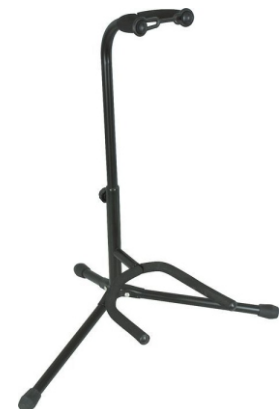
SOPORTE DE GUITARRA